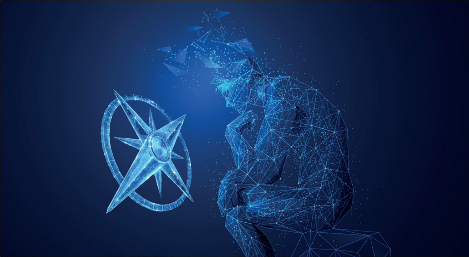
Abb. 1: Projekt Fairgeo: Wann kann man KI trauen?