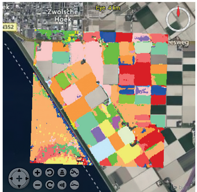
Abb. 3: Feldfrucht-Klassifikation über Land und Wasser (Modell bereitgestellt von Wageningen Research)

Ausgangspunkt für FAIRgeo bilden die Coverage-Standards von ISO/OGC/Inspire, insbesondere das Coverage Implementation Schema (CIS) und die Datenwürfel-Anfragesprache Web Coverage Processing Service (WCPS). Die rasdaman-Engine erlaubt darüber hinaus, ex-