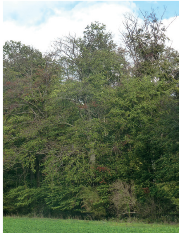
Abb. 2 und Abb. 3 | Trockenschäden im Holzbestand