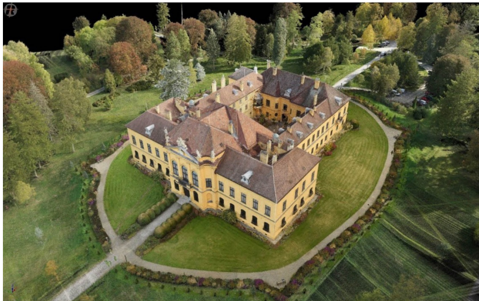
Abb. 2: Punktwolke aus einer Befliegung mit dem RiCOPTER

Anhand der Zeitstempelung von Trajektorie und Scandaten werden erste Punktwolken erstellt, deren absolute und relative Genauigkeiten bei einigen wenigen Zentimetern liegen. Für größtmögliche relative Genauigkeit wird die UAV-Punktwolke (siehe Abbildung 2) mit der Software RiPRECISION ausgeglichen. Sie analysiert die korrespondierenden Ebenen zwischen den einzelnen Flugstreifen und errechnet anhand dieser unter Berücksichtigung der lokalen GNSS-Genauigkeiten neue, verbesserte Trajektorien.