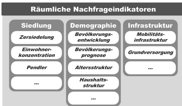
Abb. 1: Beispiele für Indikatoren der Mobilitätsnachfrage

Auf Basis einer Definition und Auswahl von Faktoren für eine bestehende und zukünftige Mobilitätsnachfrage (vgl. Abb. 1) werden Methoden der Geoinformatik angewendet, um einerseits belastbare Indikatoren abzuleiten und diese andererseits Siedlungskernen zuzuordnen. Die für kleinräumige Aussagen notwendige Datenbasis wird aus Raumdaten der Landesverwaltung (Raumplanung, Verkehrsplanung) sowie regionalstatistische Raster von der Statistik Austria bereit. So werden räumliche „Nachfrageindikatoren“ (z. B.: Einwohnerdichte im Haltestelleneinzugsbereich, Altersstruktur, Schul- und Arbeitspendler, Grundversorgungseinrichtungen) erstellt, die eine Typisierung von Siedlungskernen nach ÖV-Affinität ermöglichen. Zusätzlich werden regionstypische Merkmale wie Topographie, Siedlungsdichte oder Urbanitätsgrad, die für die ÖV-Erschließbarkeit relevant sind, in das Bewertungsmodell integriert. Diese komplexe Problemstellung soll – im Gegensatz zu vielen Verkehrsmodellen – mit einem nachvollziehbaren GIS-Modell bewältigt werden, dessen räumliche Übertragbarkeit gegeben ist.