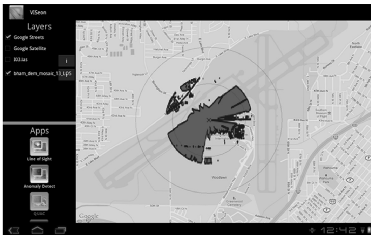
Abb. 3: Eine interaktive App zur Analyse von Sichtverbindungen, gestartet von einem nativen Android Client. Der Nutzer steuert einen Zielbereich an und zieht interaktiv einen Kreis, um die erforderlichen Parameter zu setzen. Die ENVI Services Engine findet die entsprechenden Daten im Katalog und gibt die resultierende Sichtverbindungsanalyse in Form von Vektordaten an den Client zurück. (EXELIS VISUAL INFORMATION SOLUTIONS 2012).

Die ESE ist für Enterprise-Webservices ausgelegt und kann so konfiguriert werden, dass sie mit verschiedenen Varianten von Thin- und Thick-Clients funktioniert, einschließlich Webbrowsern, Betriebssystemen von Mobiltelefonen (Android, iOS) und Desktop-Anwendungen wie ENVI oder ArcGIS (siehe Abbildung 3).